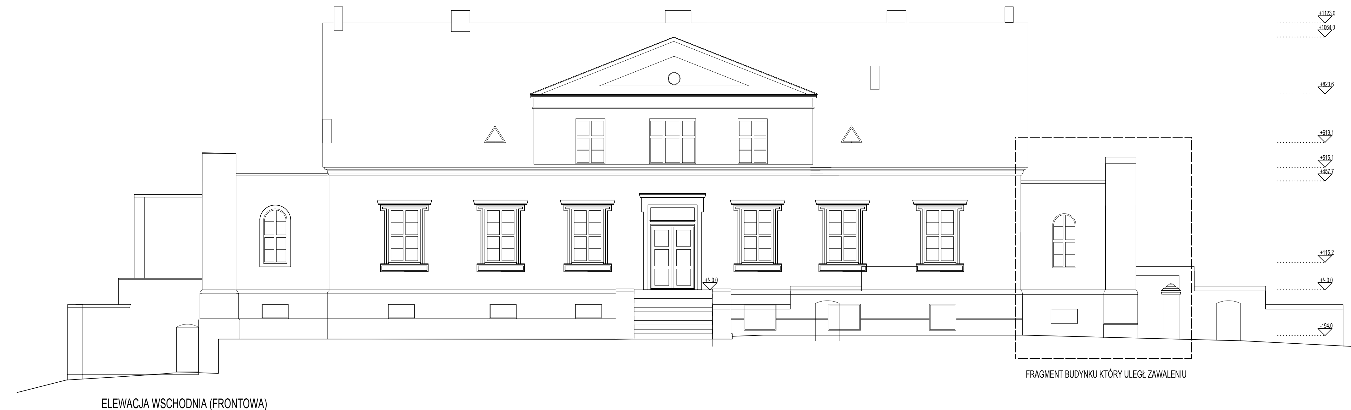
ELEWACJA WSCHODNIA (FRONTOWA)