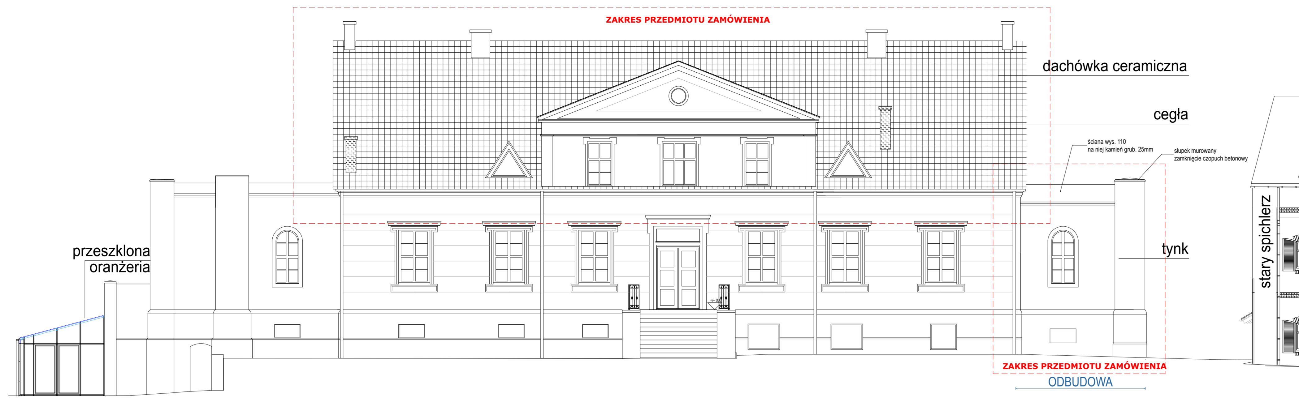
1 E-Wsch Elewacja Wschodnia 1:100