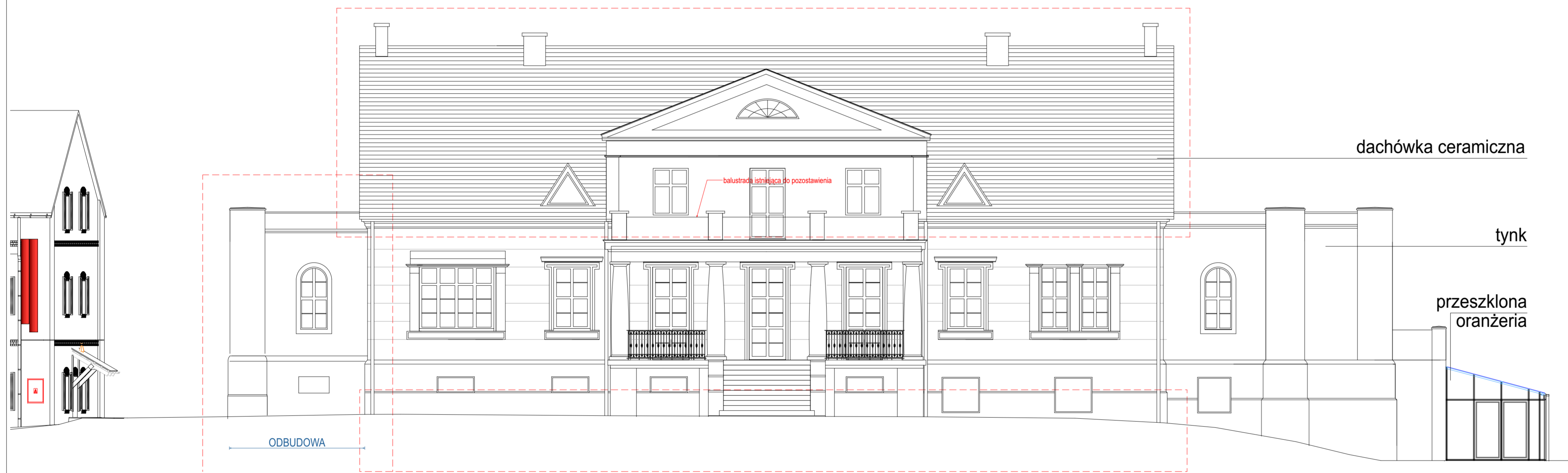
4 E-Zach Elewacja Zachodnia 1:100